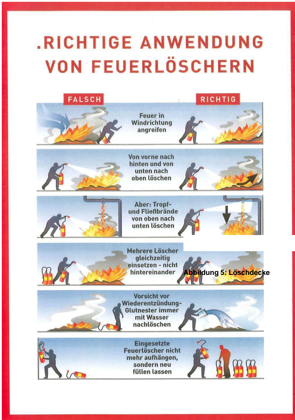
Abbildung 3: Benützung eines Handfeuerlöschers

Wichtige Hinweise bei der Benützung eines Handfeuerlöschers (Abb. 3):