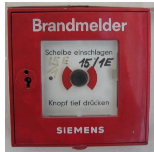
Abbildung 1: Druckknopfmelder

Im gesamten Haus sind bei den Aus- und Notausgängen sowie den Zugängen zu den Stiegen Druckknopfmelder installiert (rotes Kästchen auf weißem Hintergrund mit schwarzem Knopf, siehe Abb.1). Dieser ist durch eine Glasscheibe geschützt, die bei Gebrauch eingeschlagen werden muss. Durch anschließendes Drücken des Knopfes wird nicht nur im Haus (Sirenen) Alarm ausgelöst, sondern auch direkt und unmittelbar die Feuerwehr alarmiert. Jede(r) Bewohner(in) ist verpflichtet, sich die Lage des nächstgelegenen Druckknopfmelders einzuprägen und diesen bei Entdecken eines Brandes zu betätigen.