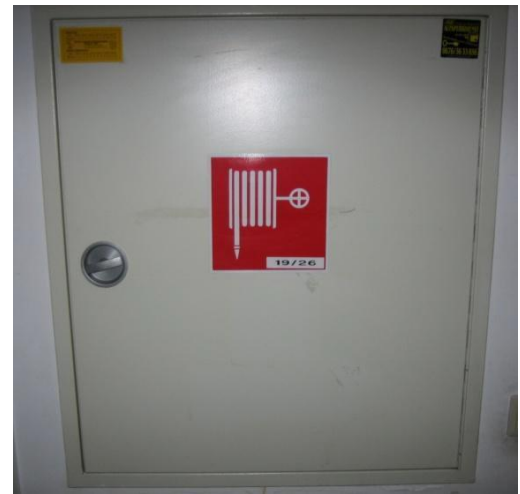
Abbildung 4: Wandhydrantenkasten

Wandhydranten sind im Gebäude installierte Wasserentnahmestellen, die zur Brandbekämpfung vorgesehen sind. Diese sind in Wandhydrantenkästen untergebracht. (siehe Abb. 4) Machen Sie sich mit deren richtigen Handhabung und Aufstellungsort vertraut. Diese sind nicht nur für die Feuerwehr vorbereitet, sondern ähnlich einem Feuerlöscher für jedermann zugänglich, um einen Brand in der Entstehungsphase bekämpfen zu können.