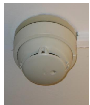
Abbildung 2: Brandmelder

Im gesamten Gebäude, Gebäudeteil oder Brandabschnitt sind an der Decke automatische Brandmelder installiert. Diese Melder lösen bei einer gewissen Rauch-, Dampfkonzentration oder einer bestimmten Temperatur Brandalarm aus. Zur Vermeidung von Täuschungsalarman der Brandmeldeanlage sind die allgemeinen Brandverhütungsmaßnahmen einzuhalten. Um die Brandmelder muss ständig allseitig ein Freiraum von mindestens 50 cm gegeben sein.